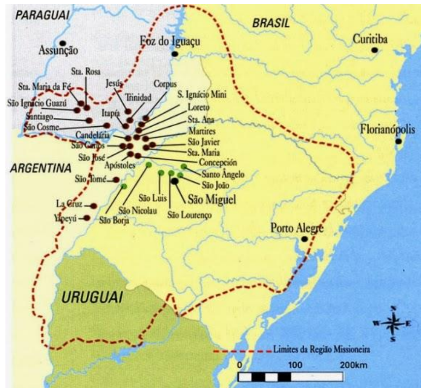
Figura 1: 30 povos missioneiros e território alcançado por suas estâncias.

Segundo o IPHAN, no século XVII os jesuítas fundaram 30 missões ( 7 missões no Brasil, 15 na Argentina e 8 no Paraguai), implantados em território originalmente ocupado por indígenas. Traduziam os esforços dos jesuítas para conversão, à fé cristã, dos guaranis, executando o processo de evangelização promovido pela Companhia de Jesus nas colônias da coroa espanhola na América, mas também houve razões de disputas territoriais entre portugueses e espanhóis. A seguir, mapa com a localização das 30 missões: