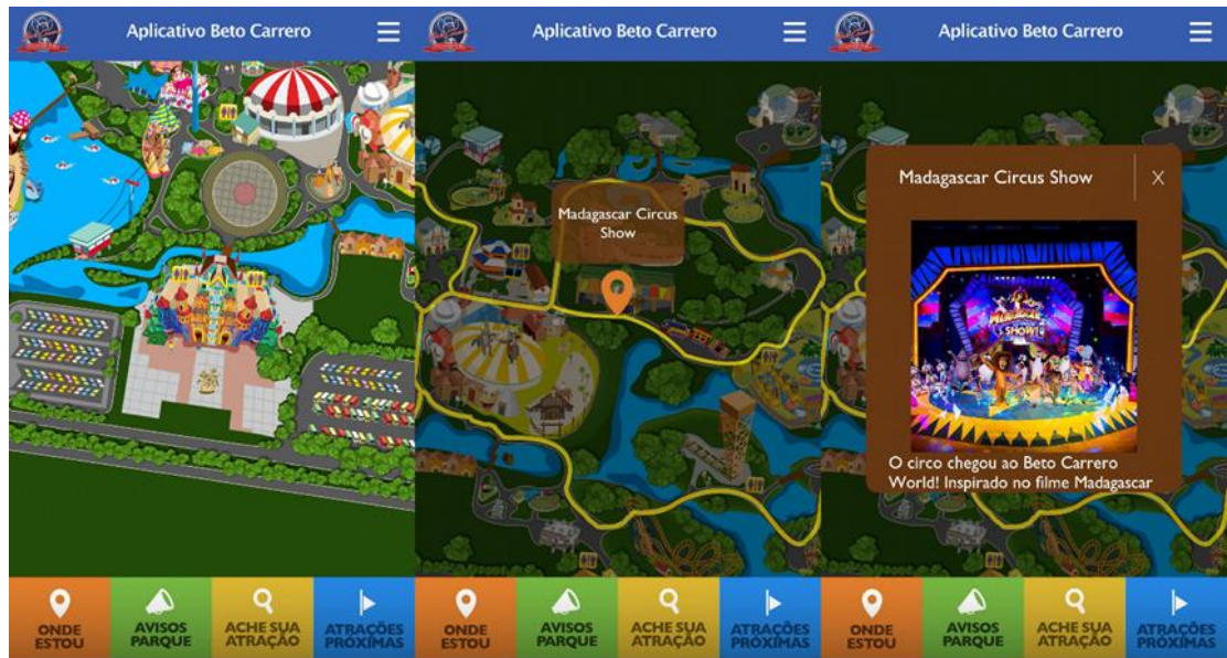
Figura 3: Aplicativo Beto Carrero