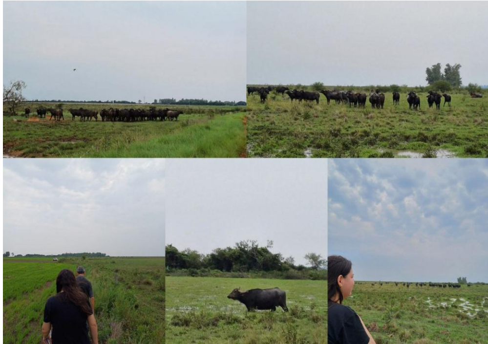
Figura 2 - Diário de Campo