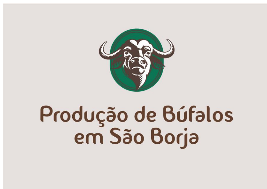
Figura 3 - Capa da Cartilha para divulgar a bubalinocultura em São Borja.

Por fim, na última etapa do estudo, foi desenvolvido um produto comunicacional, uma cartilha com as informações sobre bubalinocultura, os impactos sociais e econômicos, uma lista dos produtores e os locais que comercializam a carne de búfalo na cidade. Na Figura 3 é possível ver um esboço da cartilha.