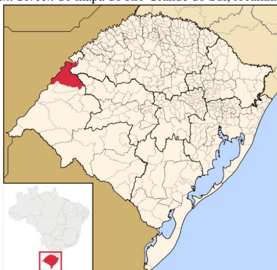
Figura 1 - Print Screen do mapa do Rio Grande do Sul, localizando São Borja.

O município de São Borja (Figura 1) está localizado ao oeste do Estado do Rio Grande do Sul, considerada a primeira cidade dos Sete Povos das Missões e fundada em 1682, por padres jesuítas (PADILHA et. al. 2017). Está aproximadamente distante a 585 km da capital do Estado, Porto Alegre. Conhecida como “Terra dos Presidentes”, onde nasceram os ex-presidentes da República, Getúlio Dornelles Vargas, nascido em 19 de abril de 1882 e João Goulart, nascido em 01 de março de 1919.