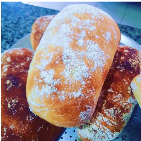
Figura 1: Pão com Fermento Biológico Seco.

Após a cocção, visualmente, os pães ficaram semelhantes, conforme Figura 1 e 2. Dessa forma, compreende-se que, para a análise sensorial com degustadores não treinados, é positivo no sentido de não deixar visível a diferença e induzir a análise.