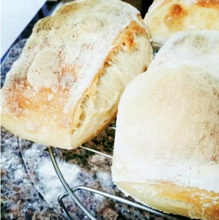
Figura 2: Pão com Fermento Natural.