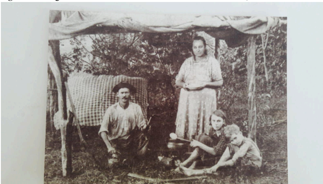
Figura 1 – Imigrantes alemães instalando-se no Rio Grande do Sul, século XIX

onde os novos colonos eram naturalizados após dois anos de residência, além de terminar o privilégio de receber lotes gratuitos, agora passando a cobrar por eles (Vogt, 2006).